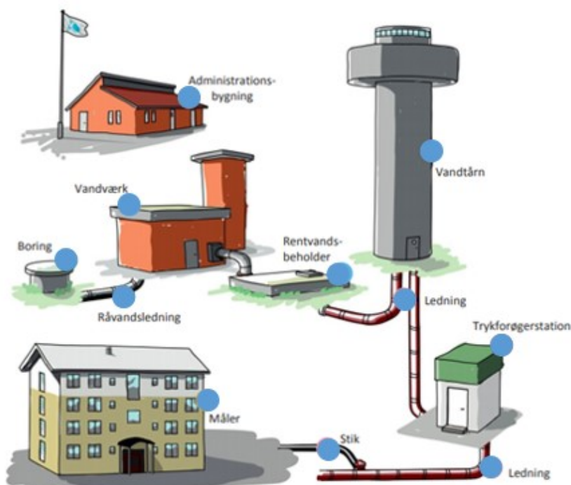
Figur 1. Drikkevandsselskabernes aktiver

Drikkevandsselskabernes primære opgaver kan opdeles i tre kategorier i form af forsyning, kvalitetstjek og administration, jf. tabel 1.